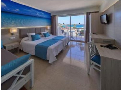
BU: Paguera Beach****.