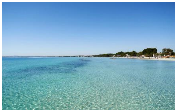
BU: Appartements Sofia**** mit direkter Strandlage.