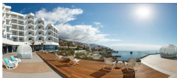
4* Baia Azul auf Madeira