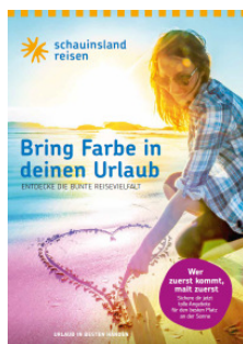
Plakat der Winterkampagne