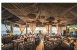
4* Ocean Breeze Resort in Khao Lak