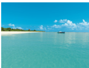
4* Hondaafushi Island Resort auf den Malediven